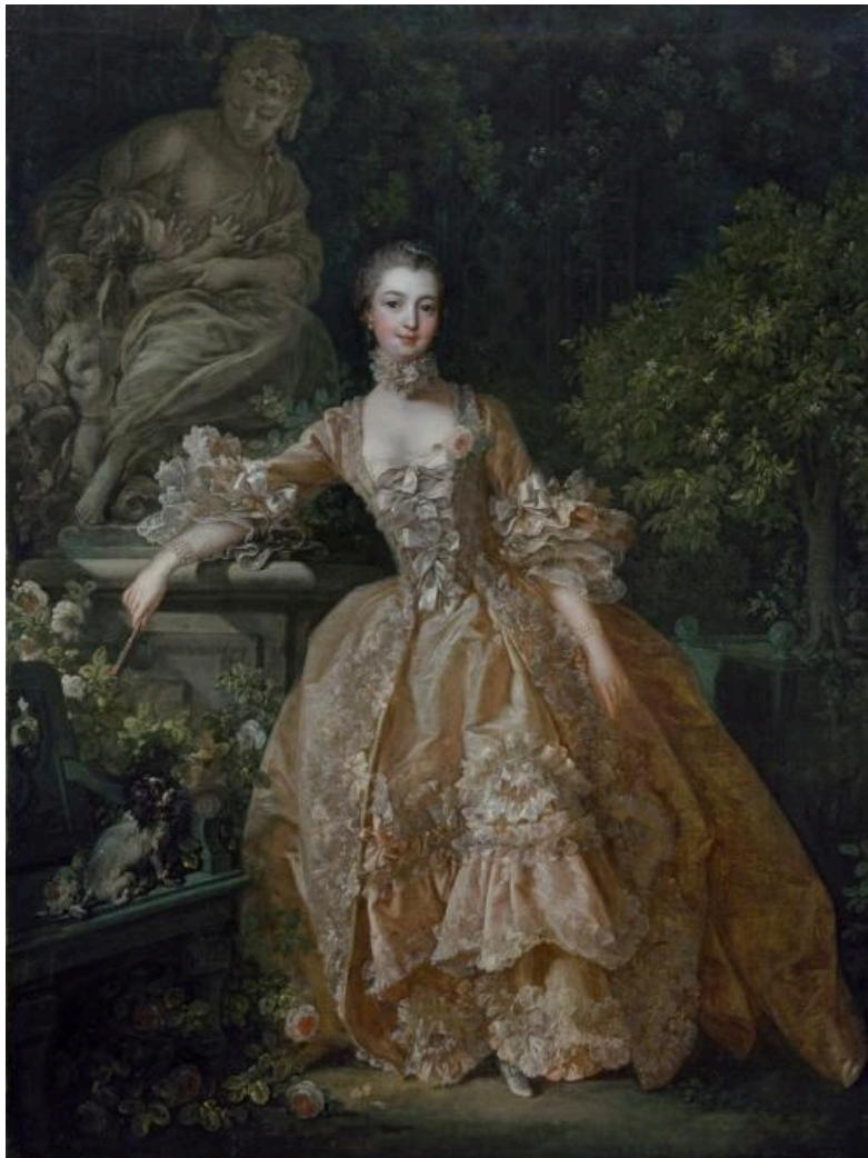
François Boucher "Madame de Pompadour", 1759, Wallace Collection London

Wir sehen eine rosenfarbene Robe à la Française, dekoriert mit unglaublich viel Spitzen, Ausgezäckter Seide, und Seidenband. Der Schmuck ist sehr dezent - da sie bereits ein Vermögen in Textil am Leibe trägt.