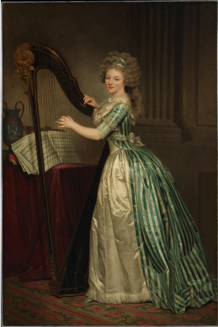
Rose-Adélaïde Ducreux, Selbstportrait mit Harfe 1791, Metropolitan Museum of New York

Eine Robe à l'Anglaise dégagé par le devant. Die Ärmel sind hochgekrempt, die Dekoration ist dem Zeitgeist gemäss äusserst zurückhaltend, aber elegant.