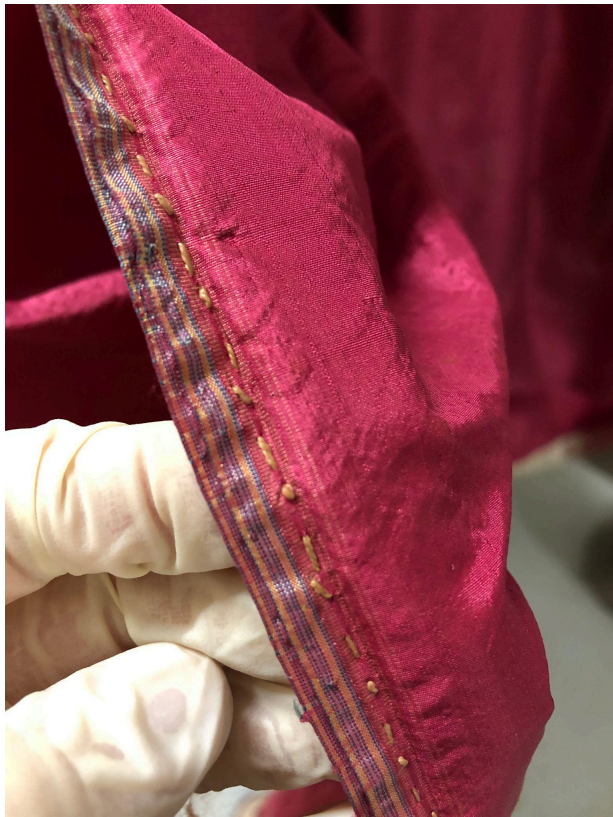
Jäckchen in der Sammlung des historischen Museums Blumenstein, Solothurn

Prinzipiell muss man sich aber keinen grossen Kummer machen, wenn man selbst denkt: "ich kann doch keine Milimeterstiche!"